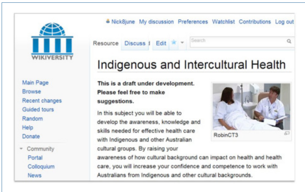
Figura 6. Indigenous and Intercultural Health (2013) en Wikiversity

Desde hace siglos, los nativos australianos y otros pueblos indígenas han sido objeto de «estudio por parte del hombre blanco». Ello ha provocado a menudo una apropiación y deshumanización del conocimiento indígena que ha beneficiado muy poco a los grupos objeto de investigación (Morgan, 2003). Wikiversity ha permitido a los desarrolladores del módulo trabajar con y para las entidades interesadas con un nivel de transparencia y responsabilidad que habría sido imposible conseguir con las plataformas tradicionales. Este carácter abierto se ha visto como una manera de afrontar parcialmente determinados recelos comprensibles y resistencias a participar en un trabajo académico (figura 6).