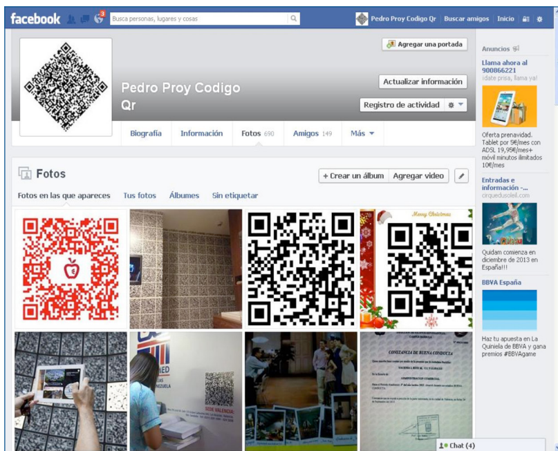
Imagen n.º 1. Repositorio virtual producido en la red social Facebook sobre los códigos QR.