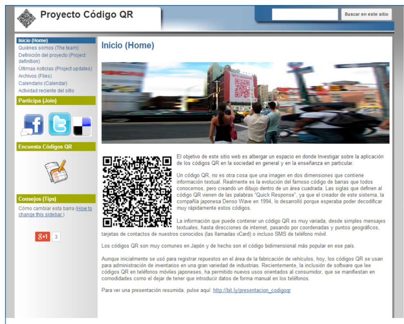
Imagen n.º 3. Portal web de acceso al proyecto ( http://t.co/31oB8W4q ).