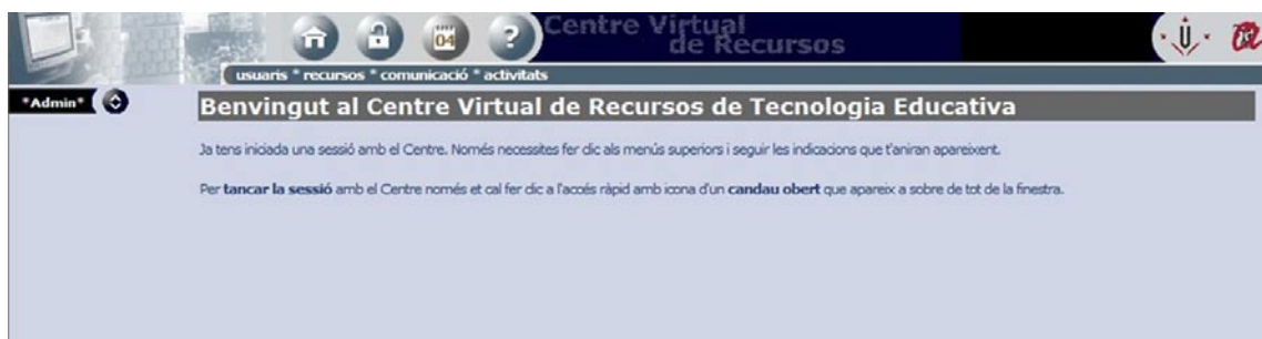
IMAGEN 7. Pantalla principal del actual centro de recursos