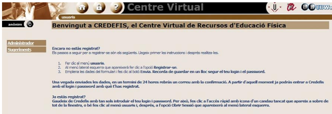
IMAGEN 6. Pantalla principal del entorno CREDEFIS