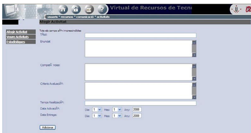
IMAGEN 5. Opciones de actividades del CVR

como consultar las estadísticas de visualización. Esta herramienta no permite el envío de archivos a los alumnos, por lo que, más que una aplicación para el desarrollo de actividades, puede entenderse como un medio de difusión de las actividades que hay que llevar a cabo en el aula.