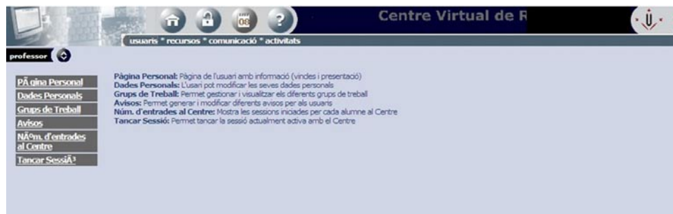
IMAGEN 2. Opciones de usuario del CVR

El primer grupo de herramientas (imagen 2) con las que se puede interactuar en el CVR son las opciones de usuario que permiten rellenar una solicitud de registro del sistema. Esta solicitud debe ser validada por el administrador, dándole derechos de acceso a la herramienta. Una vez registrados, los usuarios pueden editar sus datos personales, así como incorporar su fotografía.