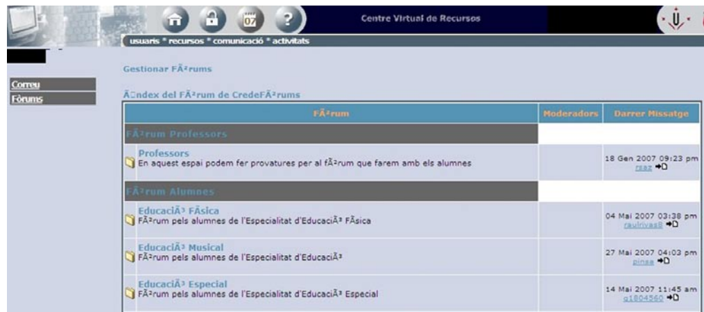
IMAGEN 4. Opciones de comunicación del CVR