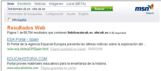
FIGURA 4. Visibilidad o enlaces externos recibidos. Estrategia de búsqueda: linkdomain:ub.es -site:ub.es