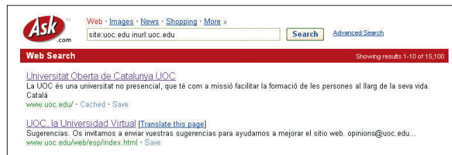
FIGURA 2. Sintaxis combinada de Ask. Estrategia de búsqueda: site:uoc.edu inurl:uoc.edu

En el ámbito académico, la utilización de ciertos formatos documentales para la comunicación científica sirve para derivar indicadores más ajustados de los contenidos. Los llamados ficheros ricos (doc, pdf, ps, ppt) pueden recuperarse directamente de algunos motores de búsqueda y están ligados a actividades de publicación