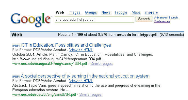
FIGURA 3. Obtención de ficheros ricos en Google. Estrategia de búsqueda: site:uoc.edu filetype:pdf

(el ps o Postscript es el formato estándar para físicos, matemáticos o ingenieros) o comunicación (el Powerpoint o ppt es el más popular para presentaciones en congresos o transparencias para el aula). En Google el delimitador utilizado es filetype: (fig. 3).